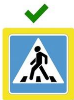
Наземный пешеходный переход

Он обозначен дорожными знаками «Пешеходный переход» и белыми линиями разметки «зебра».